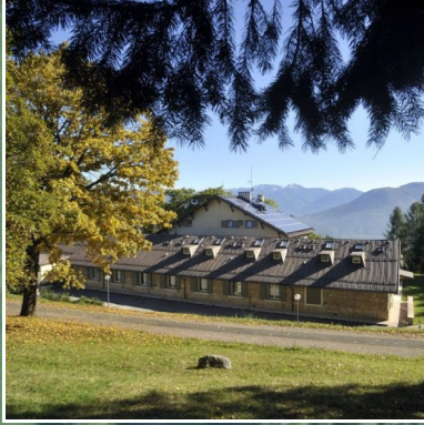
Centro Formazione e Vacanze di Candriai