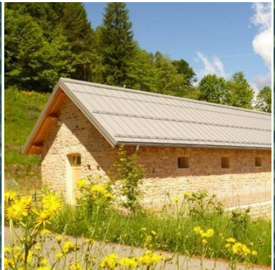
Malgone di Candriai